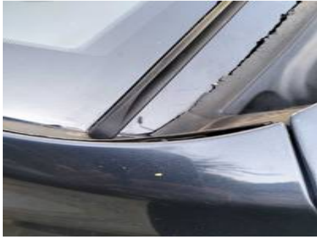
Aile avant droite (Autre Défaut)