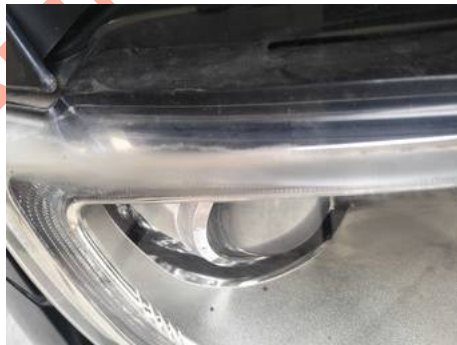
Phare avant droit (Rayure)