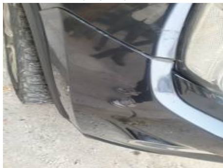
Bouclier avant (Impact)